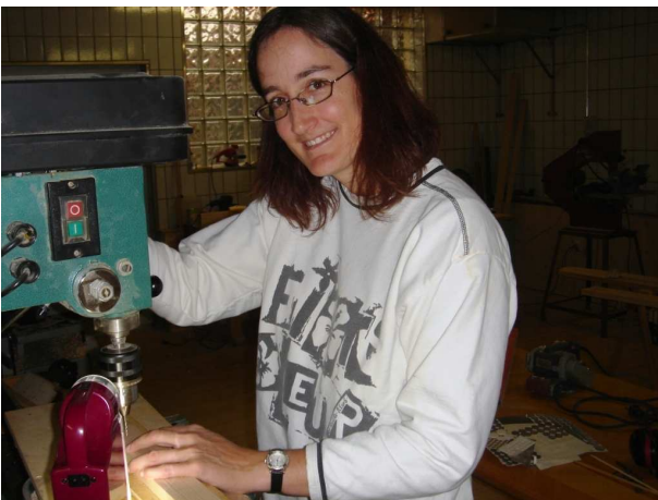
Äusserst sorgfältiges Bohren war bei den feinen Löchern für die Stege gefragt