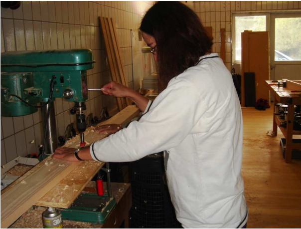
Bohren der Resonanzlöcher

Hier sehen Sie, wie meine Monochord-Liege im Oktober 2009 entstand.