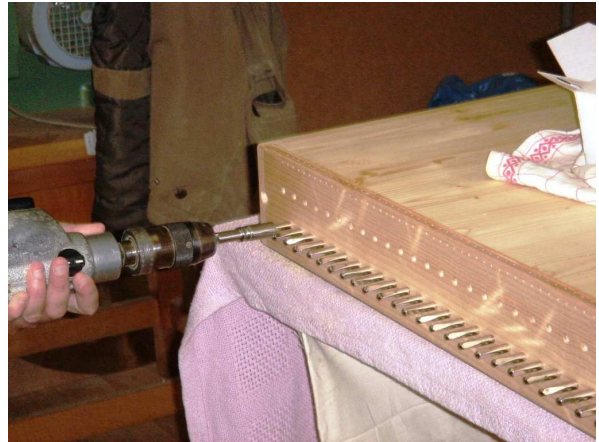
Eindrehen der Wirbel in die vorgebohrten Löcher an der kurzen Seite des Resonanzkörpers