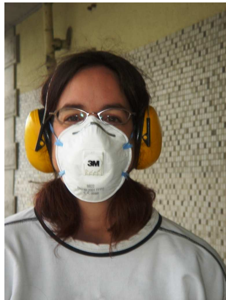
... und immer wieder schleifen