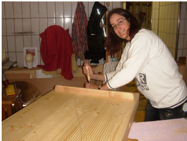
Aufziehen der Saiten