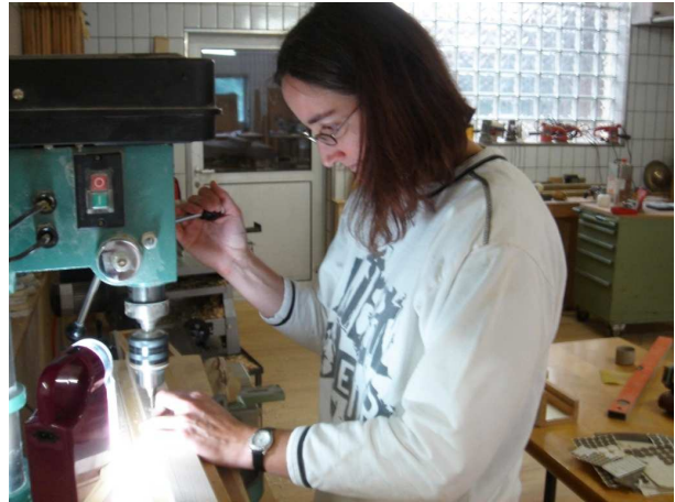
Bohren, bohren und nochmals bohren ... insgesamt über 300 Löcher