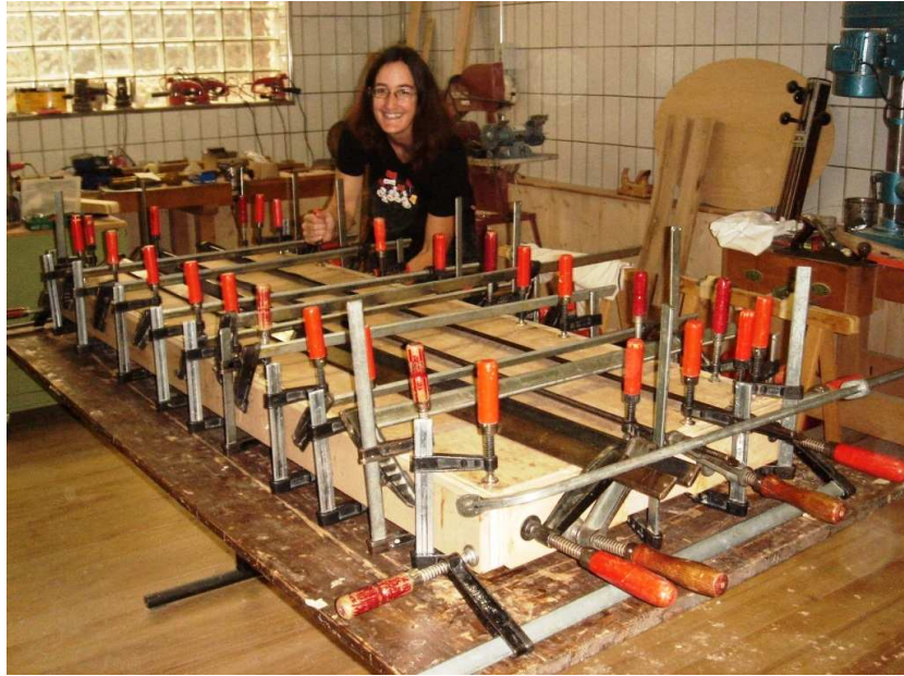
Verleimter Resonanzkörper wird zum Trocknen zusammenschraubt