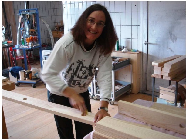
Abkanten der Resonanzlöcher